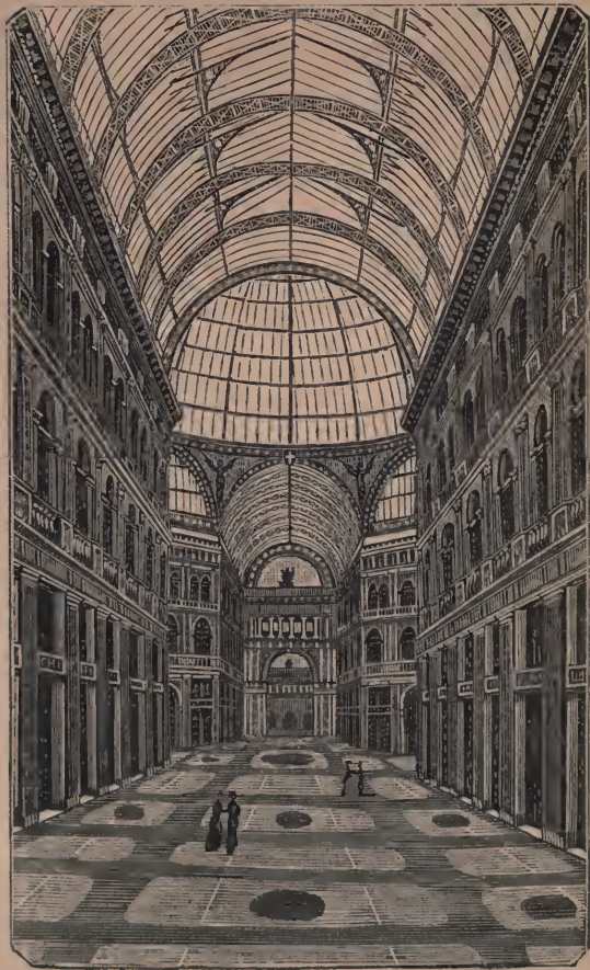
Galleria Umberto I.